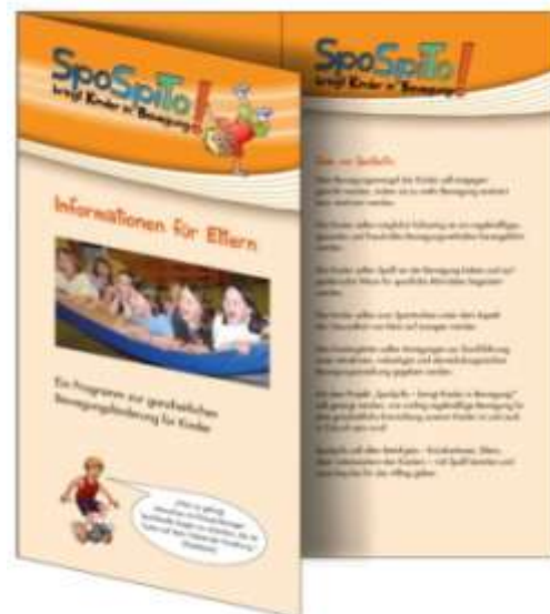
Informationsflyer für die Eltern (DIN lang)