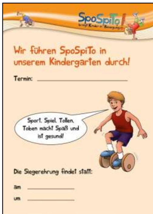
Ankündigungsplakat (DIN A3)