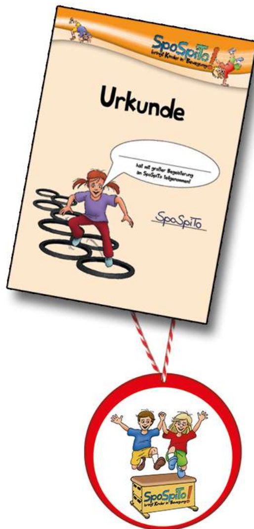
Urkunde (DIN A4) und Medaille