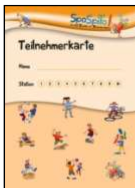
Teilnehmerkarte (DIN A5)