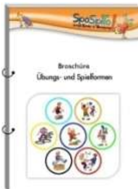
Broschüre (DIN A5)