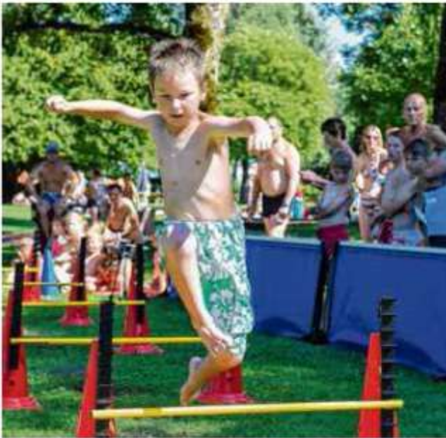
Sichtlich Spaß hatten die Kinder auch in diesem Jahr beim Cambomare-Sprint im Kemptener Freibad.